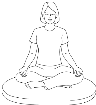
Podstawowa pozycja medytacyjna z luźno skrzyżowanymi nogami

Nogi: Jeśli siedzisz na poduszce, skrzyżuj przed sobą luźno nogi w kostkach lub tuż powyżej. (Jeżeli podczas medytacji drętwieją Ci nogi, zmień skrzyżowanie albo weź sobie dodatkową poduszkę, żeby usiąść wyżej). Kolana powinny znajdować się niżej niż biodra. Osoby, które nie są w stanie skrzyżować nóg, mogą usiąść z jedną nogą zgiętą przed drugą, bez ich krzyżowania. Możesz też ukłęknąć na ławeczce do medytacji albo wsunąć między uda i łydki poduszkę, jakbyś siedział na niskiej ławce. Jeśli siedzisz na krześle, ustaw stopy płasko na podłodze. Dzięki temu będziesz siedzieć prosto, a Twój oddech będzie bardziej naturalny.